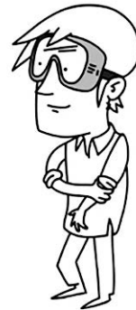
Abb. 2: Theorie, Empirie- und Praxis-Brille als drei Perspektiven auf den Umgang mit Verhalten und Konflikten (© Max von Bock, 2018; Amrhein, Badstieber & Weber, 2024, S. 12; https://umbraise.de/qualifizierung/ ).

Dem Buch nimmt man ab, dass es aus einer dezidiert inklusionspädagogischen Perspektive auf die Phänomenbereiche Verhalten, Erleben und Konflikt im Schulsetting blickt. Dies ist ein Gewinn nicht nur für die Praxis, sondern auch für die wissenschaftliche Auseinandersetzung mit und im Förderschwerpunkt Emotionale und Soziale Entwicklung auf Ebene von Disziplin, Profession und Praxis. Die Auseinandersetzung zwischen einer inklusionspädagogischen und einer sonderpädagogischen Betrachtung der Phänomene verspricht einiges an Konfliktpotential und Kritik, erscheint aber ebenso notwendig wie sinnvoll – hat die inklusive Bewegung im deutschsprachigen Raum doch zu einem deutlichen Ausbau sonderpädagogischer hochschulischer Standorte in